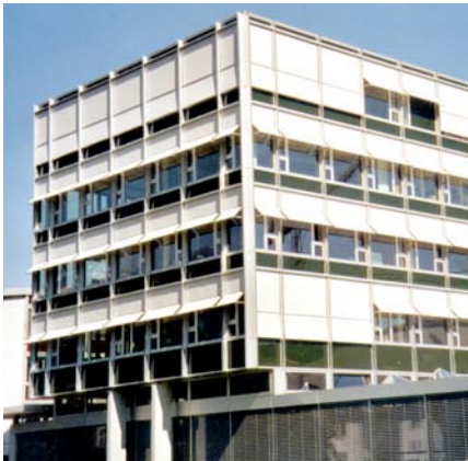
IVOCLAR AG, Schann-FL